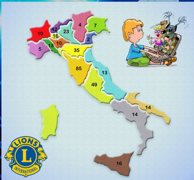
Le conferenze di "INTERconNETtiamoci... ma con la testa!" nei 17 Distretti italiani durante l'annata lionistica 2022/2023

L'organizzazione del Service non prevede costi, in quanto gli esperti di INTERconNETtiamoci mettono a disposizione gratuitamente la loro professionalità per l'esecuzione delle conferenze.